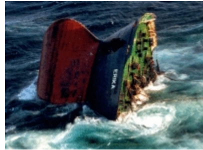
Le 12 décembre 1999, le pétrolier Erika se brise en deux.